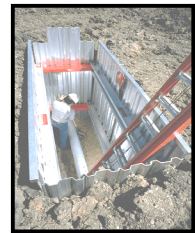
Speed Shore Corp.

A los trabajadores se les debe proporcionar un manera segura para entrar y salir de las excavaciones. Una escalera, escalera de mano, rampa, u otra manera de salida debe estar localizada en excavaciones de zanja que tienen cuatro pies (1.22 metros) o más en profundidad y a no más de 25 pies (7.62 metros) de recorrido lateral.